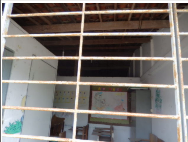
Anexo Escola Nossa Senhora Conceição - Interior