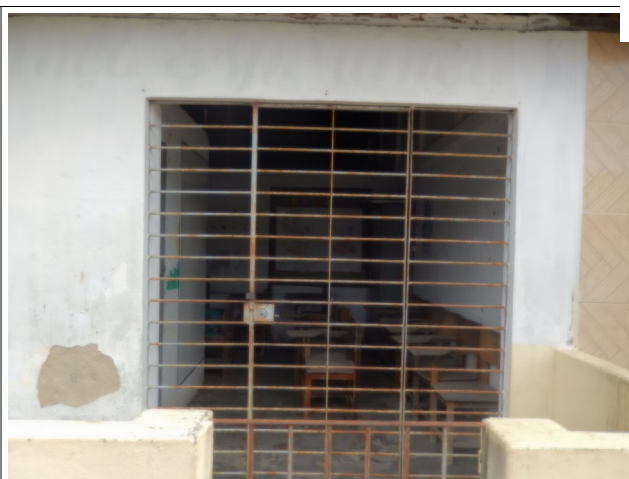
Anexo Escola Nossa Senhora Conceição - Entrada