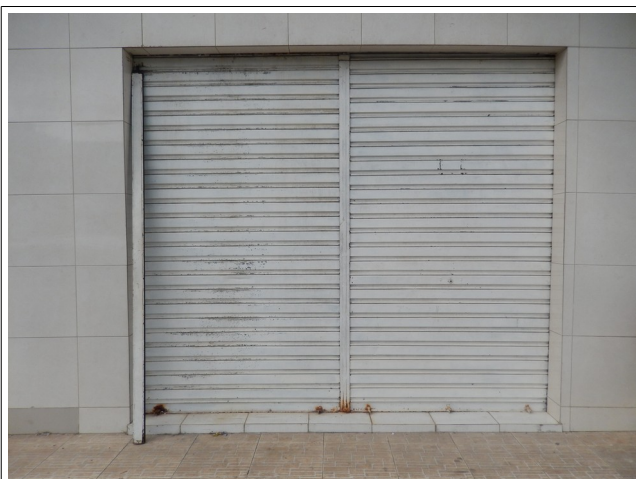
Guarda de Material, Barão de Frexeiras, 40