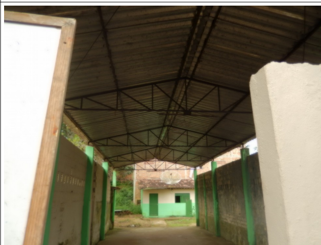
Galpão Escola Antônio da Mota