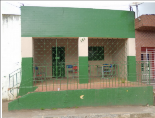
Centro Municipal de Fisioterapia