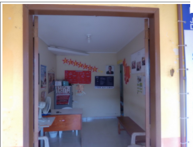
Posto Saúde da família - Interior