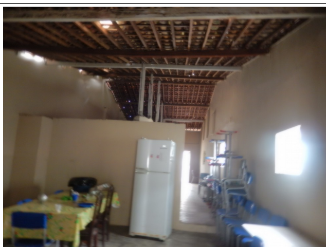
Cozinha Escola Antônio da Mota