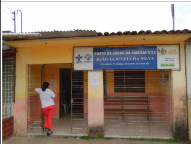
Posto Saúde da Família – Rua José T. Sobrnhho