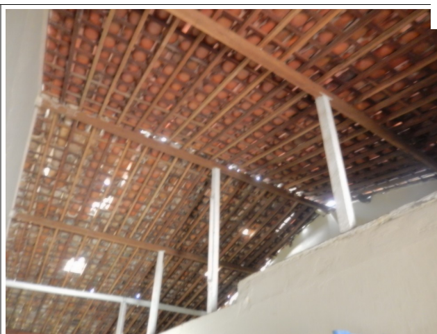
Telhado Escola Antônio da Mota