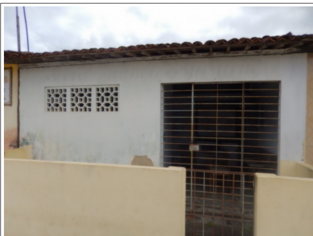
Anexo Escola Nossa Senhora Conceição