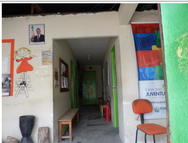
Interior da Casa da Juventude