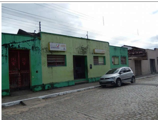
Faxada Casa da Juventude